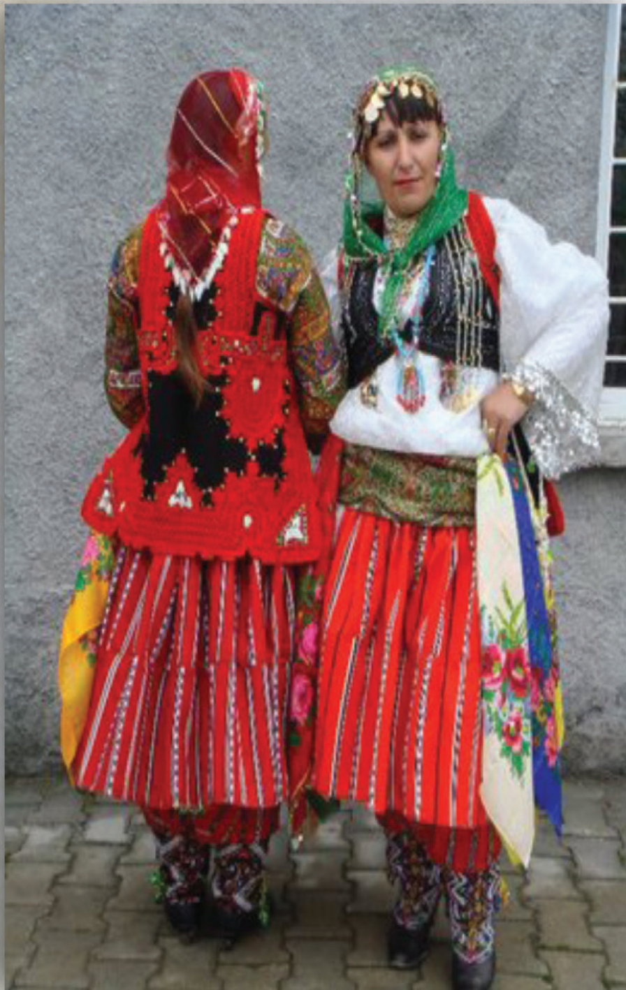
Veshje popullore maqedonase - Gorë