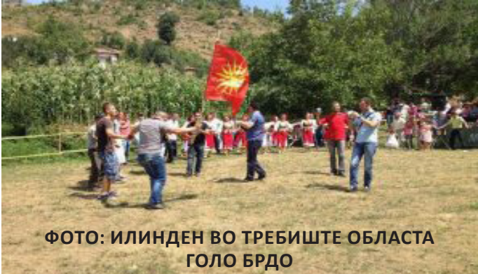
ФОТО: ИЛИНДЕН ВО ТРЕБИШТЕ ОБЛАСТА ГОЛО БРДО

која влеувале македонски и албански територии. Тоа значело дека Русија, како ментор и господар на бугарската држава, имала можност да ја прошири својата власт многу подалеку од дотогашната. Ваквата намера на Русија била осуетена од големите европски држави, кои веднаш го свикале Берлинскиот конгрес (13 јуни-13 јули 1878 год.) за ревизија на Сан Стефанскиот договор. После решенијата на Берлинскиот договор интересната сфера на влијание на Русија била сведена на Бугарија, а македонските и албанските територии биле изземени. Со тоа, рускиот проект, кој никогаш не заживеал, бил ставен вон меѓународна верификација.