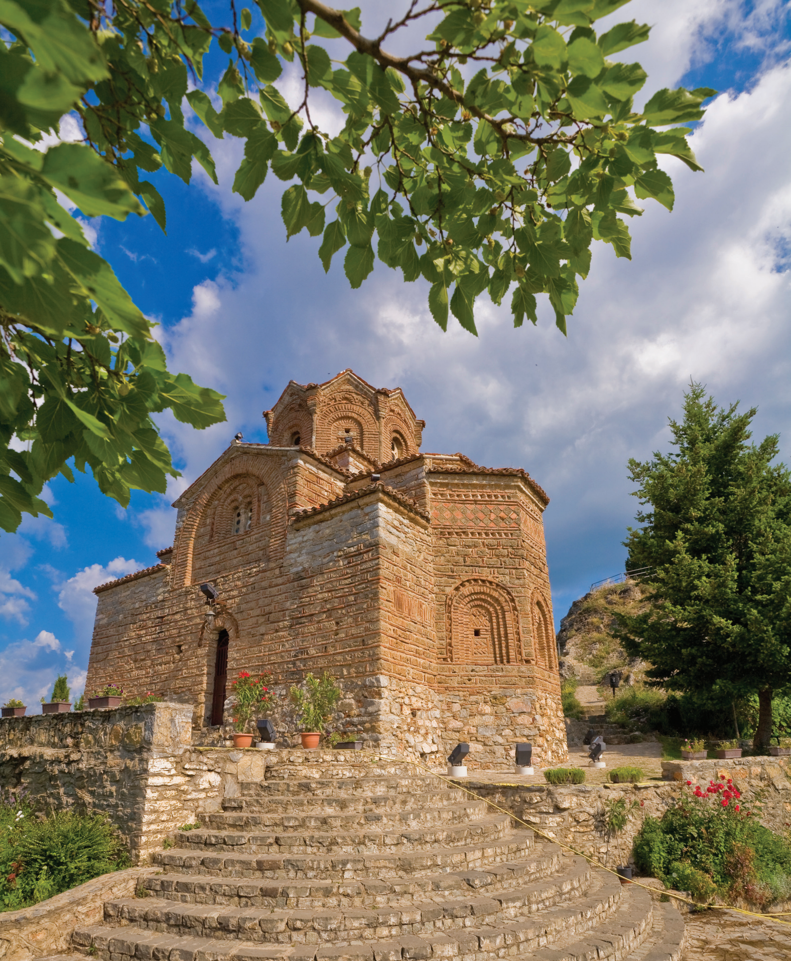
Црква „Св. Јован Канео“ - Охрид