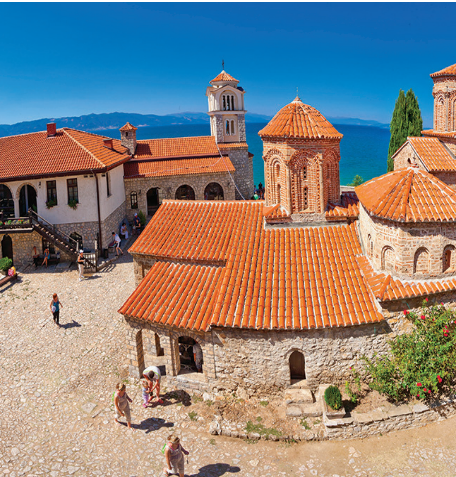
Манастир „Св. Наум Охридски“ на брегот на Охридското Езеро